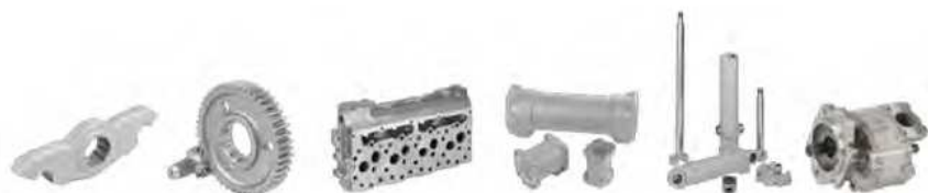
Pièces de châssis

ITR est bien connu pour fournir la gamme de pièces de rechange la plus vaste de l'industrie et des travaux publics. La gamme produit dépasse les 30 000 références en stock, incluant les pièces moteurs, les pièces hydrauliques, les composants à friction, les systèmes de refroidissement, les vilebrequins, les composants électriques, le freinage, les transmissions et embrayages, les commandes finales et moteurs réducteurs, ainsi que les pièces de châssis. Toute cette gamme de pièces adaptables est majoritairement disponible pour les engins de marque Caterpillar et Komatsu.